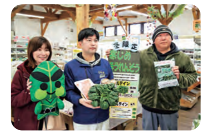
ラジオでPRする生産者とJA職員

ふれあい産直ショップ花野果は1月16日、旬を迎えている「寒じめほうれんそう」をIBCラジオで特徴やおすすめの食べ方などを紹介してPRしました。寒じめほうれんそうは寒さで糖度や栄養価が高くなることから、JAでは1年で最も寒いとされる大寒の日を「寒じめほうれんそうの日」として広く消費者にPRする日としています。