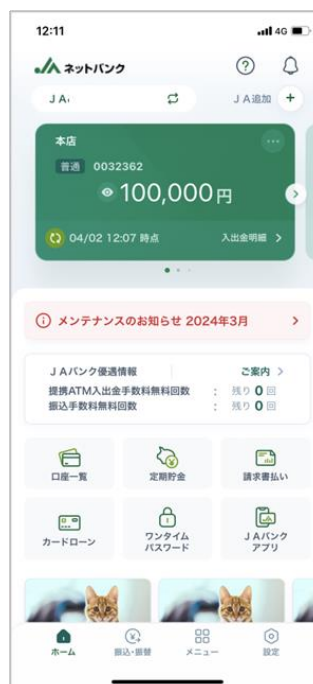
アプリトップ画面

本件のお問い合わせについては、JAネットバンクヘルプデスクもしくは、お近くのJAバンク店舗窓口までお問い合わせください。